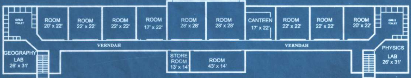
SECOND FLOOR AREA - 700 SQ. METRE