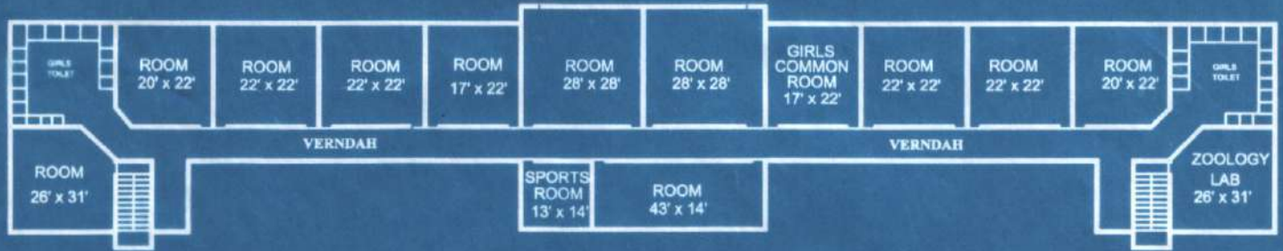
THIRD FLOOR AREA - 700 SQ. METRE