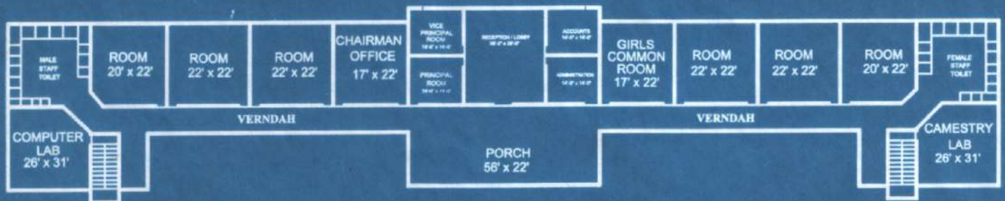
GROUND FLOOR AREA - 700 SQ. METRE